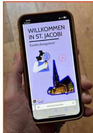
Wie die digitale Entdeckungstour künftig aussehen könnte – Testlauf auf dem Smartphone