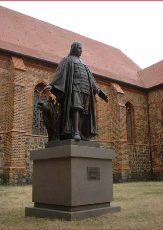
Paul-Gerhardt-Denkmal vor der Kirche in Mittenwalde

Vor 350 Jahren verstarb der lutherische Pfarrer und Lieddichter Paul Gerhardt. Dieses Jubiläum nehmen die Hamburger Hauptpastoren zum Anlass, sich in vier Predigten mit seinem Schaffen auseinanderzusetzen.